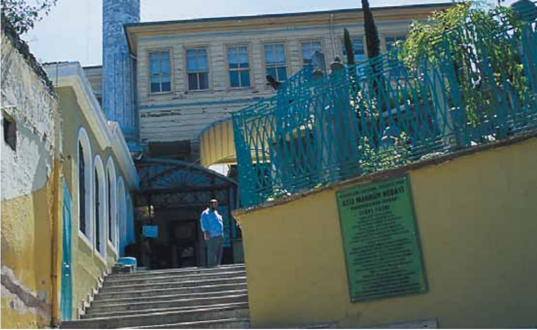
Aziz Mahmud Hüdâyi Türbesinin giriş kapısı

bedarlıklar ile bir takım ünvanların men ve ilgasına dair kanun çıkmasıyla Osmanlıdan Cumhuriyete geçişte varlık ve özelliklerini çeşitli biçimlerde muhafazaya devam eden dergahlar ve bunların birçoğunun ayrılmaz parçaları konumundaki türbeler kapatılmış ve bu türbelerin bakımını üstlenen türbedarların ünvanları da fiilen geçersiz hale gelmiştir. Bu durumdan Azîz Mahmud Hüdâyî Türbesi de etkilenmiştir. Doğal olarak 1925'ten itibaren ziyaretlere kapatılmıştır. Kapanıştan sonra türbedeki bazı kıymetli eşyalar Topkapı Sarayına nakledilmişlerdir. Türbenin bitişiğinde bulunan Cami ve müstemilatı Vakıflara ait olmakla beraber Vakıflar idaresi Türbenin durumu konusunda o yıllarda her hangi bir bakım ya da elden geçirme gibi bir husus içinde bulunmamıştır. Çünkü böyle bir ihtiyacın o yıllarda düşünülmemeyeceği aşıkardır. Ancak türbe kapalı da olsa halkın Türbeye karşı hürmet hissi ve çevresinden de olsa ziyaretleri yerel ölçekte her zaman ve her şart altında devam etmiştir. Yani görünüşte kapalı olan türbe gönüllerde daima açık kalmıştır ve hiç kapanmamıştır.