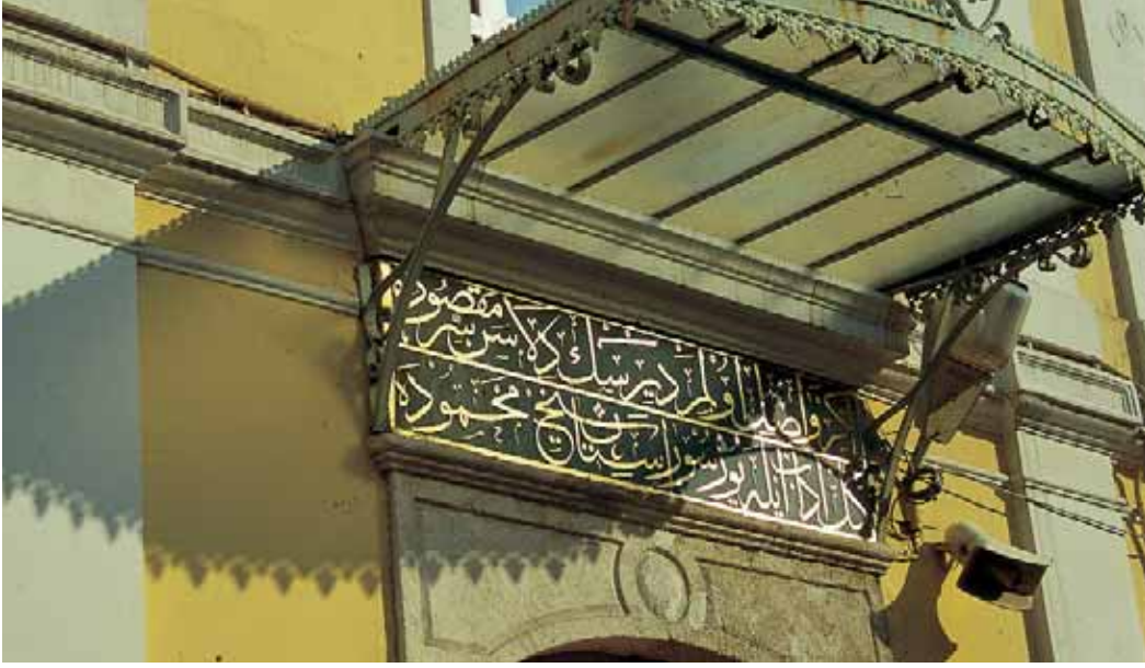
Aziz Mahmud Hüdâyî Camii'nin giriş kapısındaki kitabe

[Sultan] gâyet gayz ve gazaba geldi. Neylesin Emir Sultan'a itikâdı ve onun "kutubdur" diye şehâdeti oldukta, aydur: