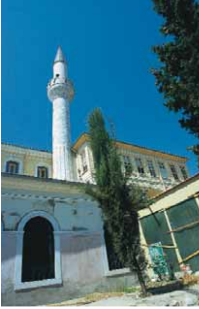
Külliyeye içerisinden bir kesit