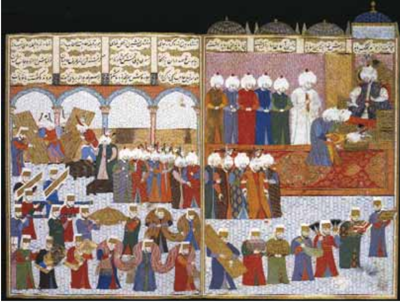
III Murat'ın İran elçilerini kabulünü gösteren minyatür