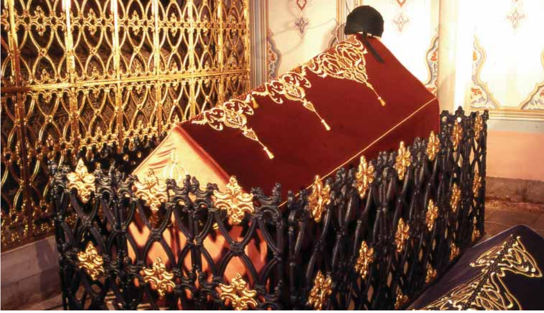
Aziz Mahmud Hüdâyi Türbesi iç kısmı

Bildirimizin giriş bölümünde, Hüdâyi Divânında dostluk kavramına girmeden önce, kültürümüze mal olmuş bazı dostluk hikâyelerine yer verilecektir. Ardından, Azîz Mahmud Hüdâyi Divânı'nın İstanbul Süleymaniye Kütüphanesi, Hacı Mahmut Efendi Bölümü 2372/2 numarada kayıtlı bulunan nüshadaki dost redifli iki şiir ile Gel gönül dost illerine gidelüm /Yürü gönül yürü dost illerine /Kande dürür dost ili / Yürü bülbül yürü dost illerine /Cânım seni özler seni nakaratlı beş şiir esas alınarak dostluk kavramı işlenecektir. Ayrıca divânda bulunan diğer dost muhtevalı bazı beyitlerden de yararlanarak divandaki dostluk kavramını ele alacağız.