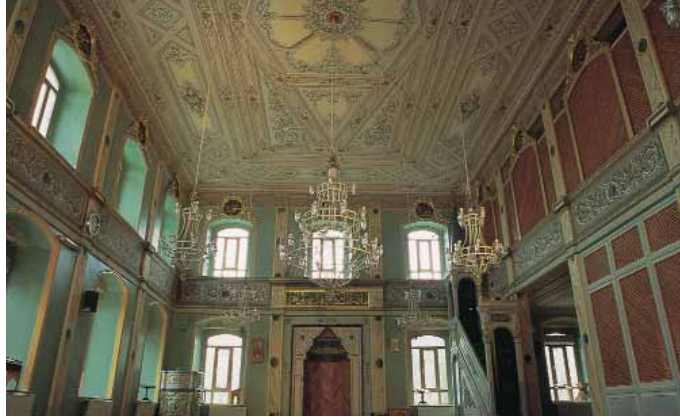
Azîz Mahmud Hüdâyî Camiinden genel görünüm