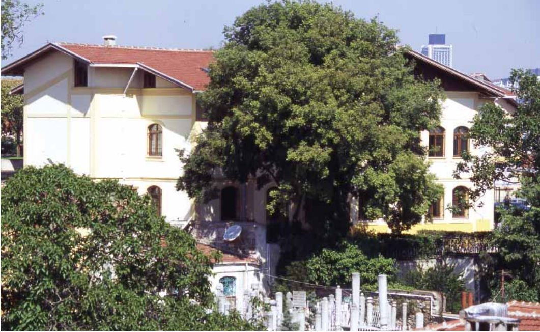
Azîz Mahmud Hüdâyî vakfı'nın bugünkü binası

gibi padişahlara mektuplar yazıp, öğüdler vermiştir. IV. Murad (1623 -1640)'a saltanat kılıcını kuşatmıştır. Ferhad Paşa ile Tebriz Seferi'ne katılmış, zaman zaman da saraya gidip, padişahlar ile sohbetlerde bulunmuştur 4 .