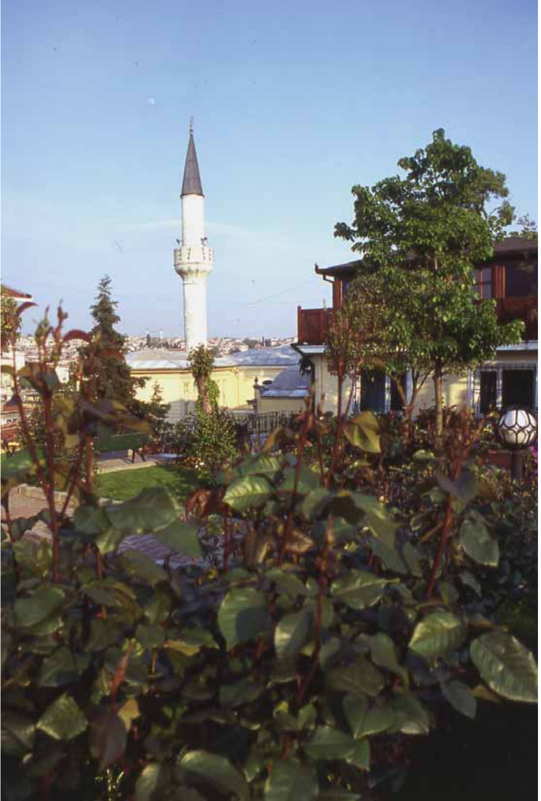
Aziz Mahmud Hüdayi Külliyesi