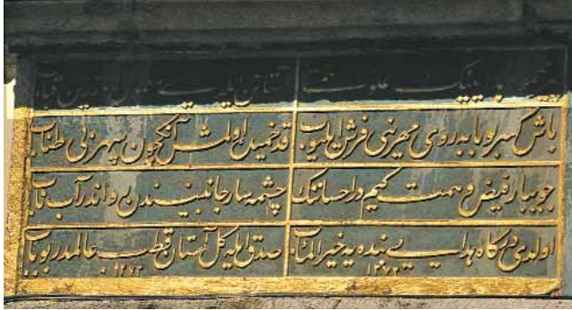
Azîz Mahmud Hüdâyî Külliyesi'nin giriş kapısındaki Kitabe

mazından evvel okunan ilâhi) verilir. Mukabelesi selatin camileri ayarındadır. Cami-i şerifin avlusunda ve etrafında fevkâni ve tahtani mahfilleri vardır. Zaviye kapısında müteaddit çeşmeleri bulunmaktadır. Zaviye hücreleri cami etrafındadır. Şeyh dairesi başka olup, müstakil meşruta menzilleri dahi vardır.... Hüdâyî Mahmud Efendi'nin yaşı 92 ye geldiğinde (H-1038) M1628 tarihinde rihletleri vaki olmuştur” diye anlatır.