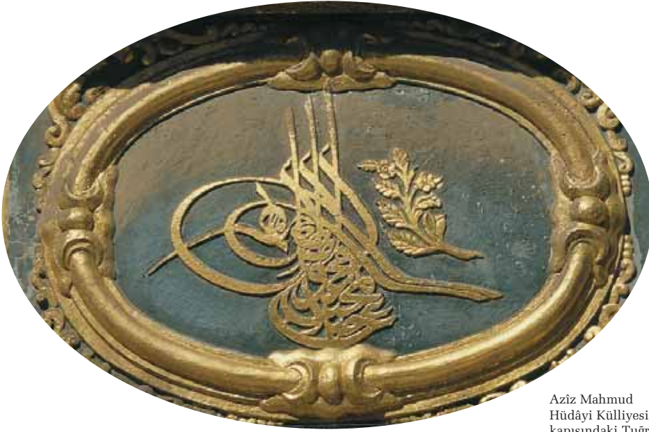
Azîz Mahmud Hüdâyî Külliyesi'nin giriş kapısındaki Tuğra

30 Kasım 1925 tarihinde 677 sayılı “Tekke ve Türbedarlıklar ile Birtakım Ünvanların Yasaklanması ve Kaldırılmasına” dair olan Kanunla etkinliğine son verilen cami-tevhidhane bu tarihten itibaren sadece cami olarak kullanılmaktadır. Zaman içinde selamlık bölümü, derviş hücreleri gibi mekanlar ortadan kalkmış olup ayakta kalan cami, türbe, hünkar mahfeli, hazire, cümle kapısı ve çeşmeler Vakıflar Genel Müdürlüğüne 1975 de tamir ettirilmiştir. Zamanımızda Azîz Mahmud Hüdâyî Vakfı Külliyesinin bakımı, korunması, yaşatılması hususunda büyük emek göstermekte, ayrıca aşevi halen görevini mükemmel bir şekilde devam ettirmektedir.