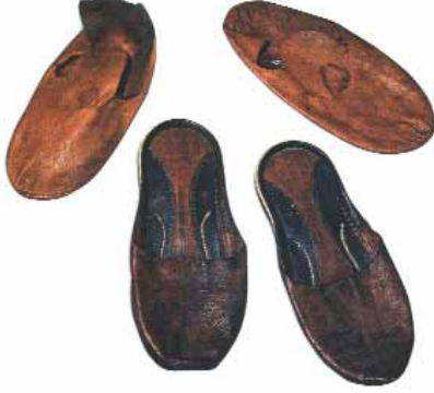
Aziz Mahmud Hüdâyî ait Edik ve Çedik

viyyetin “he”sine ve devr-i vücûda delâlet eder. Vedûd isminde ebrâr ve mukarabînin makâmına işâret vardır. Eğer “vâdd” kelimesi, ism-i fâil olarak düşünülürse seven ve âşık anlamına; ism-i mef’ûl olarak kabul edilirse sevilen ve ma’şûk mânâsına gelir. 99