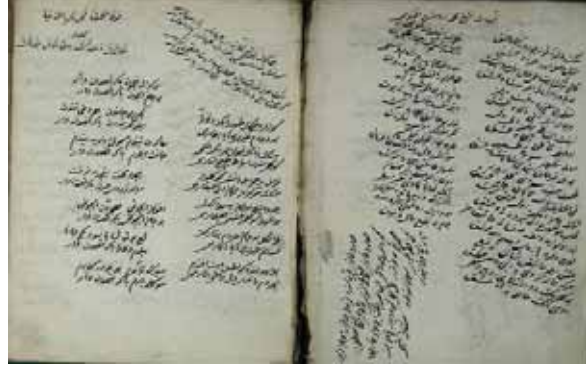
A. Nesib Efendi mecmuasının iç sayfaları

İlâhîlerde ana tema, günahkâr olma korkusu, Allah'ın bağışlamaması korkusu dolayısıyla mağfiret talebi, peygamber sevgisi, peygamberden şefahtalebi, züh-dî bir hayat arzusu, bazen aşkın ateşinden elem ve kederden sevgiliye serzeniş olarak sıralanabilir.