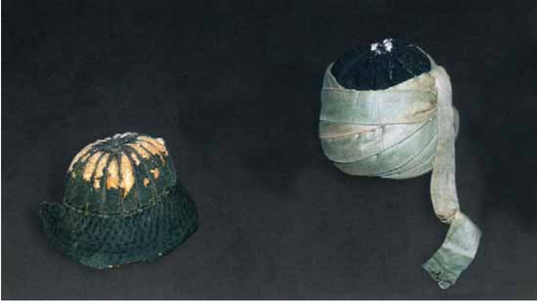
Pîr Üftade Dergahında destarsız, yeşil on sekiz terklı Taç, yeşil destarlı koyu nefsi terklı Celveti Tacı

namazı, akşamın farzı ve sünnetinden sonra dört yahut altı rekat evvabin namazı, ve her abdest akabinde iki rekat şükr-i vudû namazı, öğlenin ve yatsının son sünnetlerini dört kılmak tarîkatımızın âdabındandır.