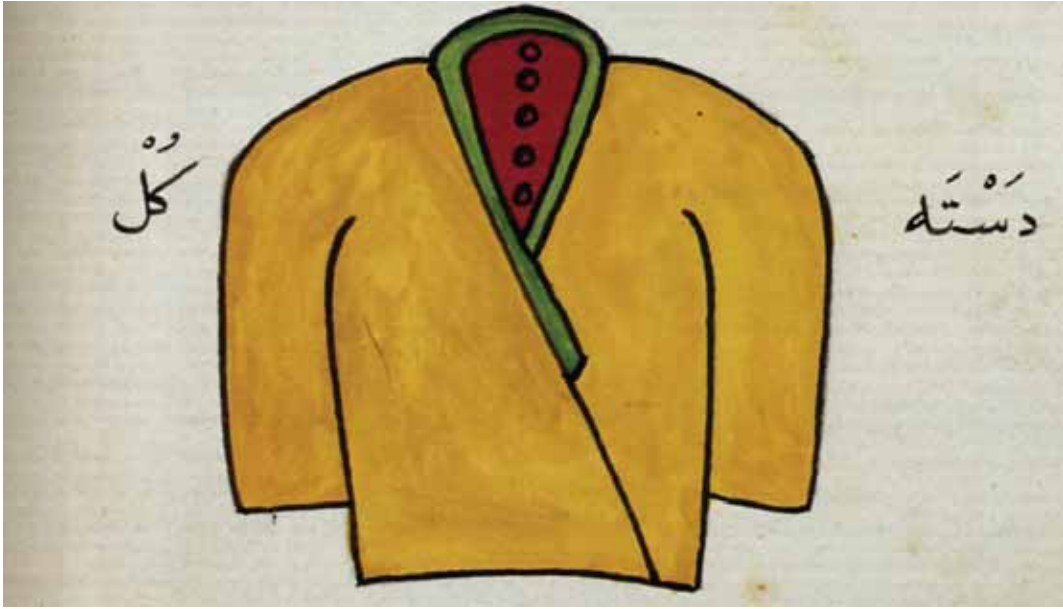
Destegül adı verilen derviş giysisi

refik olup ruh ve nefis akıl ve kalp cümlesi mârifetle âlem-i melekûtu seyr ederler. Cümlesinin muradı Hak olur. Burada ihlas nuru zâhir olup ayne'l-yakîn hâsıl olup nûr-ı Muhmamediye vâsıl olur.