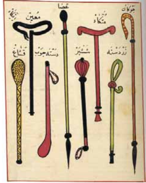
Asâ ve müttekâlar

kimsenin merâtib-i tevhîdden hangi makâmdadır, bulup kendini o makâmdan a'lâya say ettire. Eğer daha yükseğe kadir olmazsa o düşman olan makâmında ziyâde çalışıp tevhîde meşgul ola, ta kendisi o düşmandan kavi, galip olup düşmanın zu'fu zâhir olunca hemen Hak'dan gayriyi gönlüne getirmeyip daima huzur meallâhta ola.