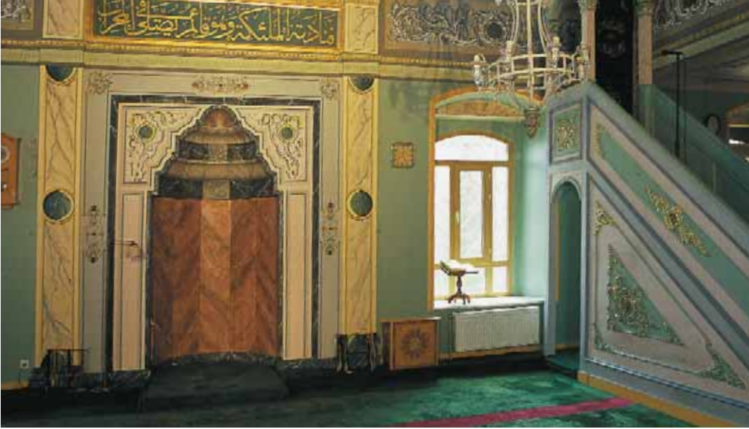
Aziz Mahmud Hüdâyi Camii içi