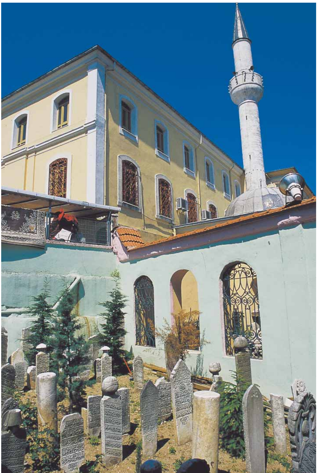
Aziz Mahmud Hüdäyî türbesinin yanındaki hazireden bir bölüm