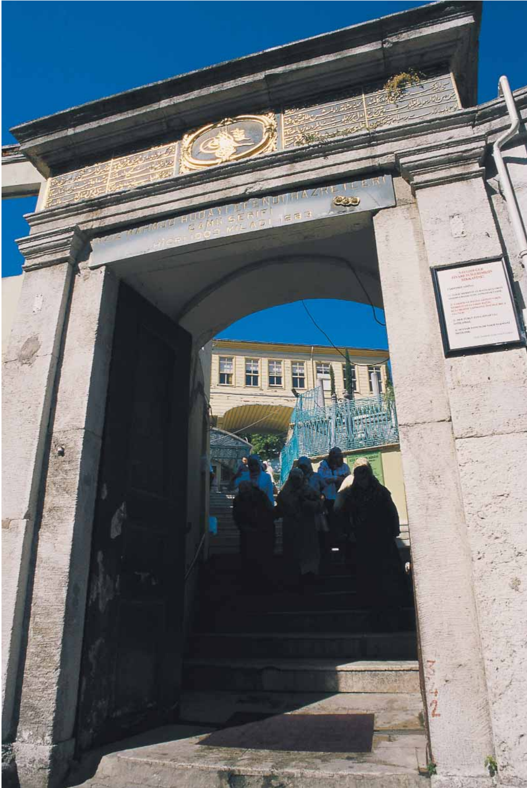
Aziz Mahmud Hüdayi Külliyesi cümle kapısı