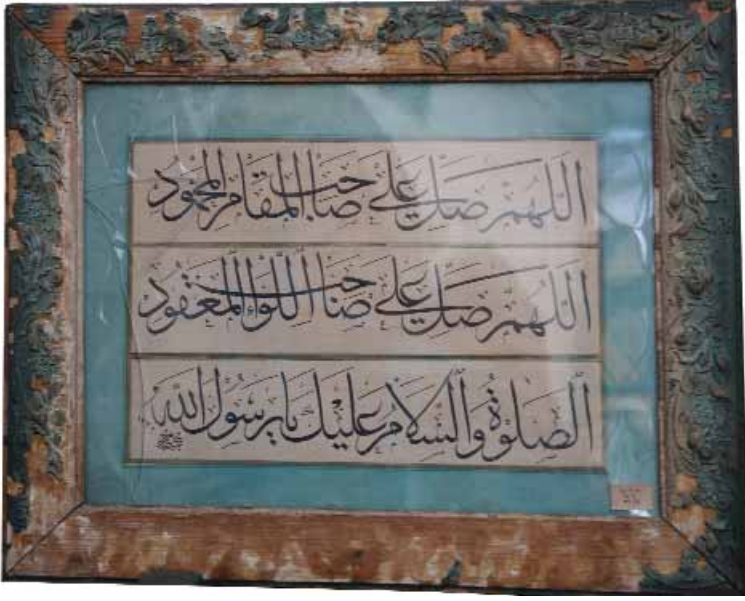
Aziz Mahmud Hüdâyi Türbesinde bulunan bir hat Levhası

Oturur taşra yollarda şeyatın Olur, pes orta yolda ismet-i din