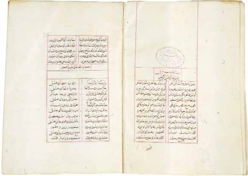
Aziz Mahmud Hüdâyi'nin bir eseri