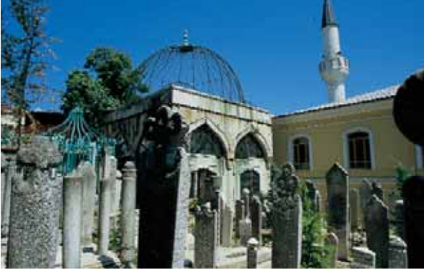
Aziz Mahmud Hüdayî Camii ve üst hazire