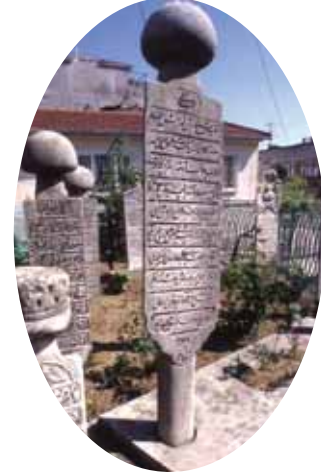
Hazreden bir kesit

yalnız bir hâl ve makâmı açıklamakla yetindiğini belirtmektedir. Burada bir “fasıl” olarak tevbe kavramını bu on tasnife göre tanımlar; ondan sonra ehl-i sülûkun menzillerini açıklamaya başlar. Müellif her menzilden birer konuyu açıkladığından bazen geniş açıklamalarda bulunur.