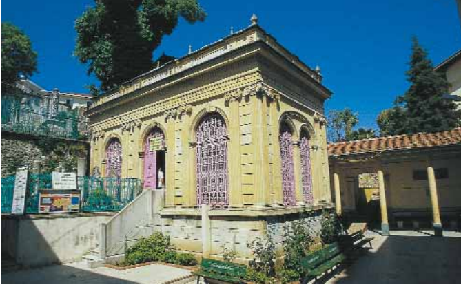
Önceleri Hüdâyi Kütüphanesi olarak kullanılan binâ