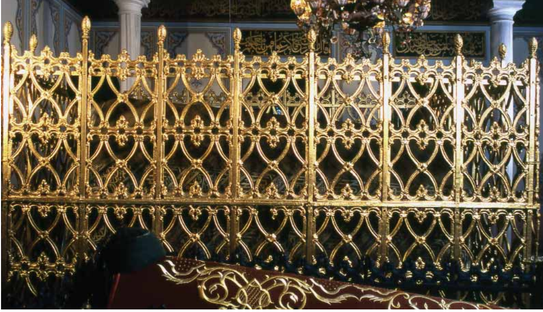
Aziz Mahmud Hüdâyî Sandukası

Hüdâyî, vaaz ve nasihat vermek için belli âyetleri tefsir etmiştir. Bu noktada iki ayrı hususa özellikle dikkat çekmekte fayda vardır: