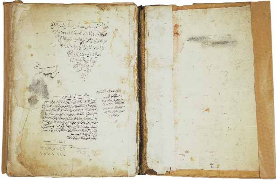
Aziz Mahmud Hüdâyî'nin tefsirinden örnek bir sayfa

olan Nefâisü'l-mecâlis adlı tefsiri Hüdâyî yazmamış, onun bir çok kaynağa müracaat ederek hazırladığı geniş tefsir notlarını halifelerinden Filibeli Şeyh İsmail b. Alaaddin Efendi 2 (ö. 1052/1642) cem ve tertip etmiş, Mushaf'ın dizilişine uygun olarak yeniden yazmıştır. İsmail Efendi, Nefâisü'l-mecâlis 'e yazdığı mukaddimede bu durumu şöyle ifade etmiştir: 3