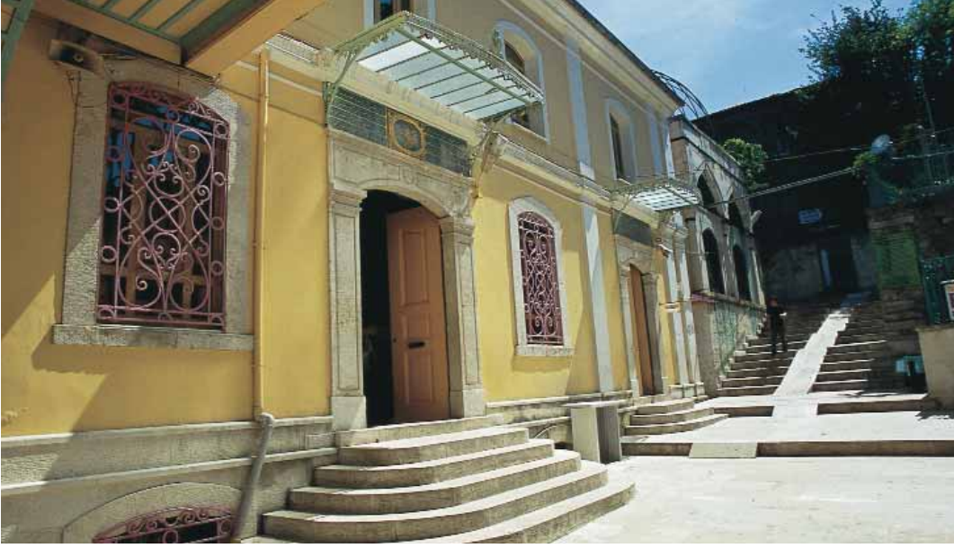
Aziz Mahmud Hüdâyî Cami girişi

Sonra bir adamın Hz. Aişe'ye gelip “Ben ne zaman muhsin olduğumu anlarım?” diye sorup onun “Ne zaman kendini kötü bilersen o zaman.” dediği, adamın “Ne zaman kötü olduğumu anlarım?” diye sorduğunda ise “Kendini ne zaman muhsin bilersen o zaman.” diye cevap verdiği kaydedilmektedir. Bunun akabinde Nuh'un gemisinin Cudi dağında istikrar bulduğu, çünkü Nuh'un (a.s.) kendini hakir gördüğü, onun için dağların en küçüğü olan Cudi'yi seçtiği bildirilmektedir.