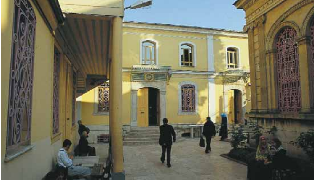
Aziz Mahmud Hüdâyî Câmii Avlusu