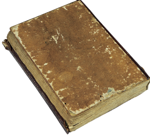
Azîz Mahmud Hüdâyî'nin Nefâisü'l-Mecâlis adlı eserin cilti