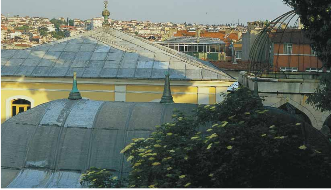
Külliyenin kuşbakışı görünümü

Gönüllere şifâ olan kamu derde devâ olan Bize Hakk'tan atâ olan Muhammed Mustafâ geldi. 34