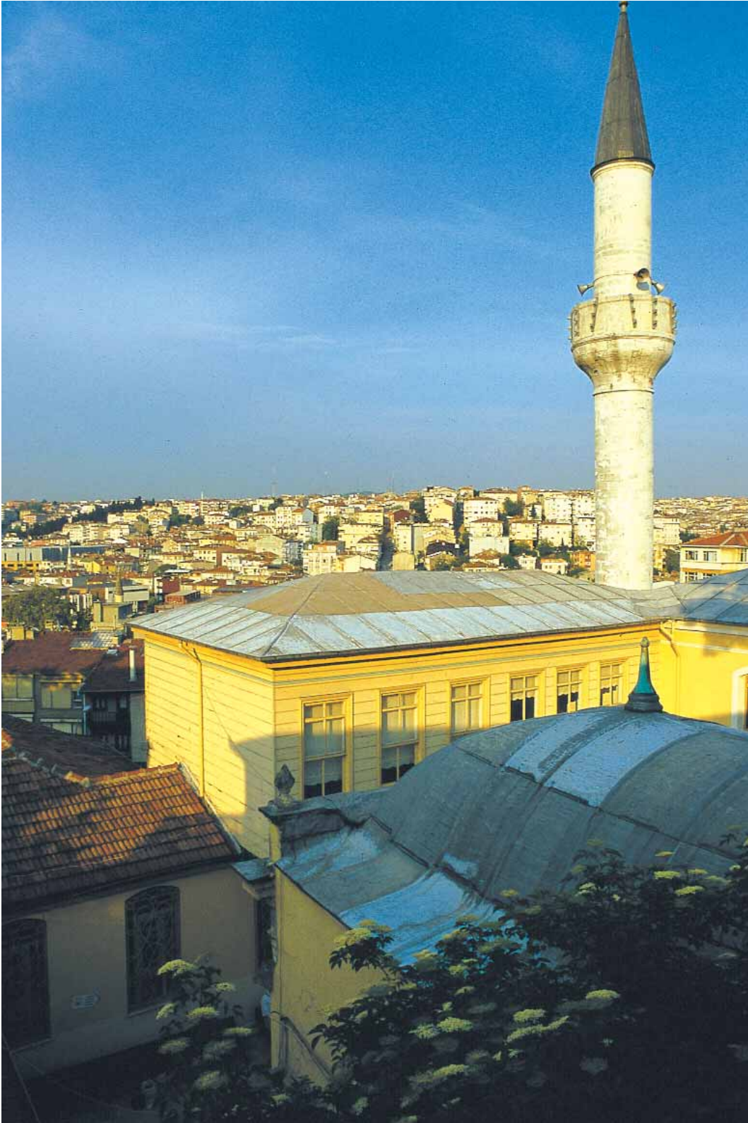
Kütüphane ve Hünkar mahfili